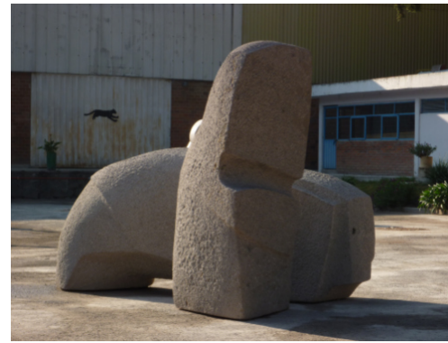
Fiesta Brava | 2010 | Mexico, Tlaxcalla | piedra vulkanico taille direct, partiell geschliffen | Höhe ca. 220 cm