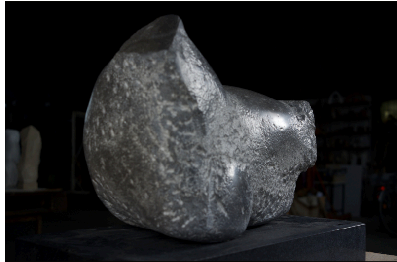
Torso Animal II | 2020 | Valonischer Blaustein, taille direct, partiell geschliffen Höhe 28cm