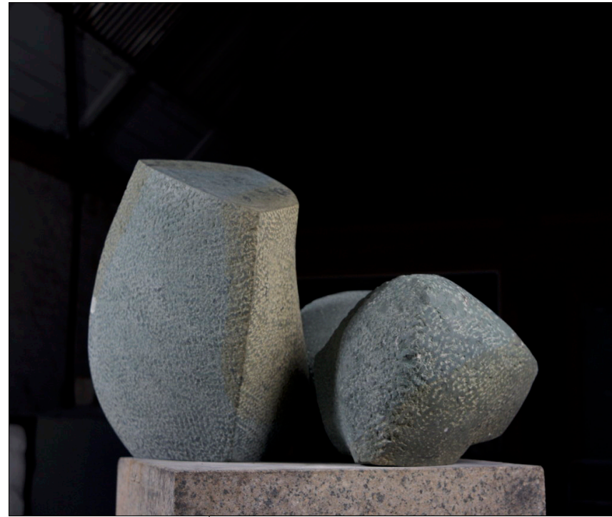
Segmente (drei Teile) | 2013 | Anröchter Dolomit | taille direct, partiell geschliffen | Höhe 37 cm