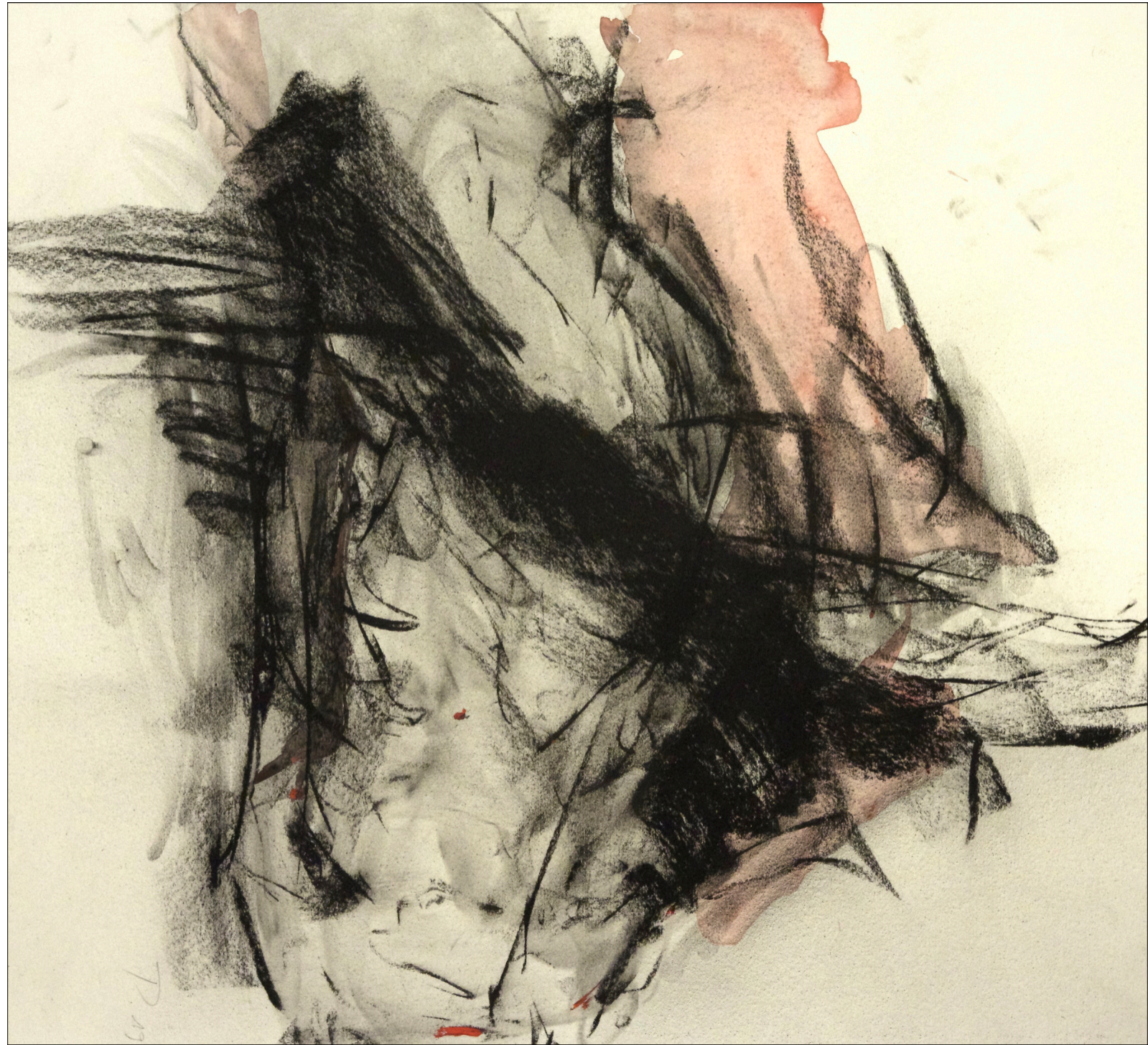
Zeichnung 563 | 2019 | Kohle und Aquarell auf Bütten 54 x 61 cm