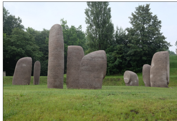
Foghorns | 2013 | Erfurt, Behördenzentrum Steigerwald Kunststein | elf Teile | am Ort geschalt, gestampft und bearbeitet | Höhe ca. 120-340 cm