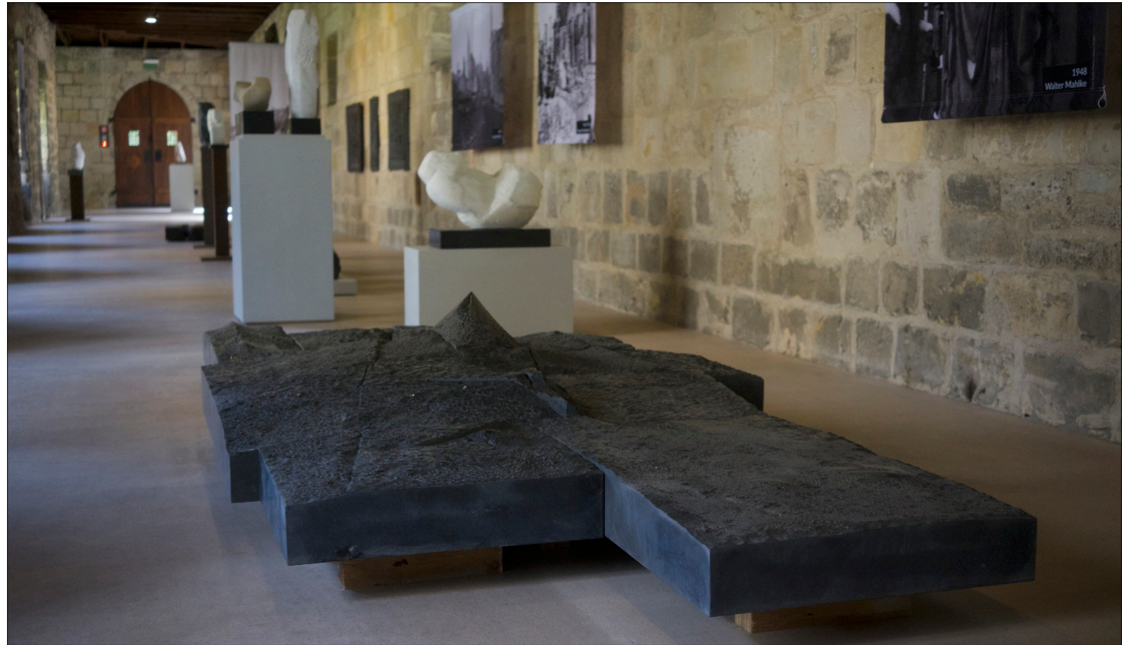
Stadtlandschaft Gaza Bodenrelief | 2025 Schwarz Schwedisch (Ebony Black) taille direct, partiell geschliffen und poliert Höhe 36 cm Länge 310 cm Tiefe 104 cm elf Teile