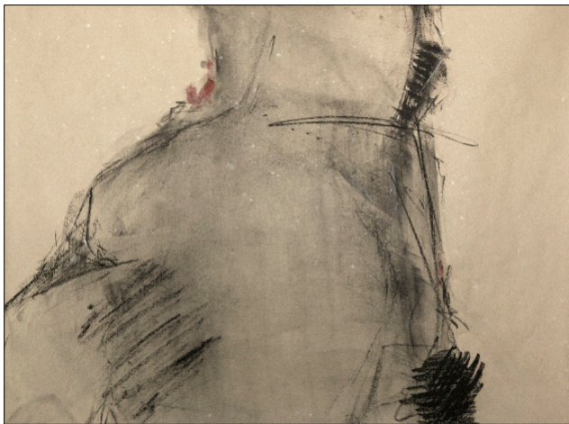
Zeichnung 516 | 2019 | Kohle auf Bütten 48 x 63 cm