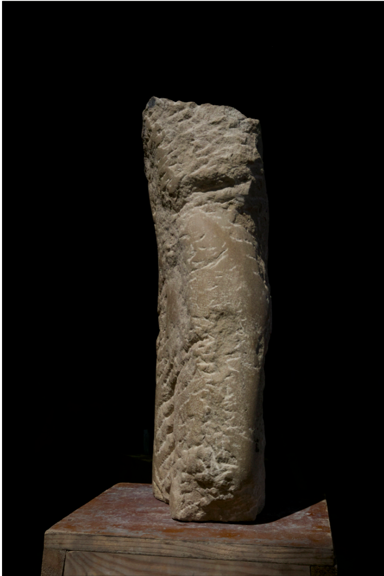
Torso (Stele) II | 2018 | Thüster Kalk | taille direct, partiell geschliffen Höhe 62 cm