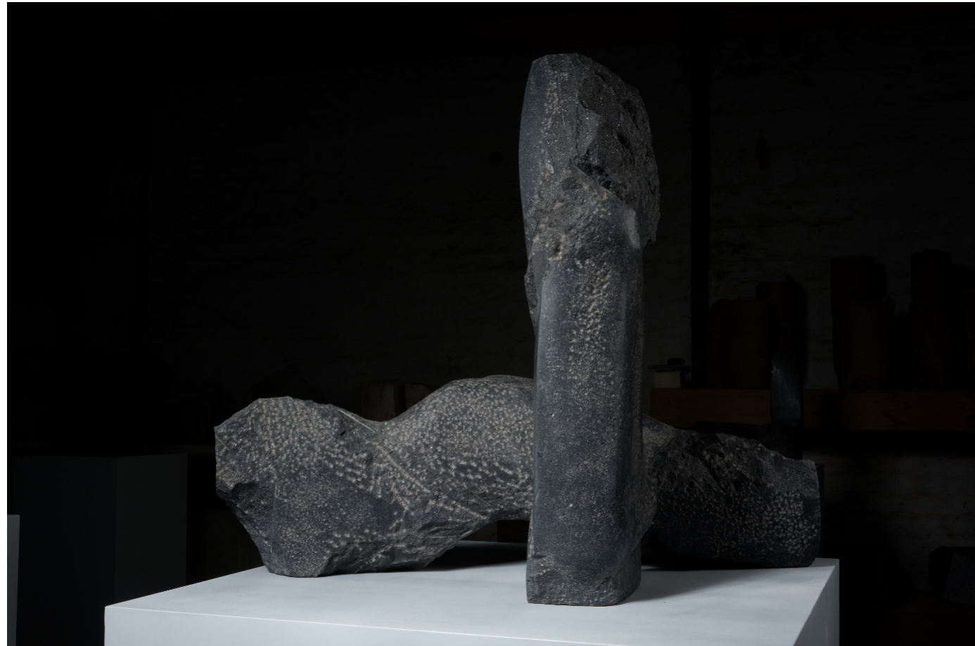
Paarung | 2019 | schwedischer Diabas (Ebony Black) taille direct, partiell geschliffen Höhe 80 cm