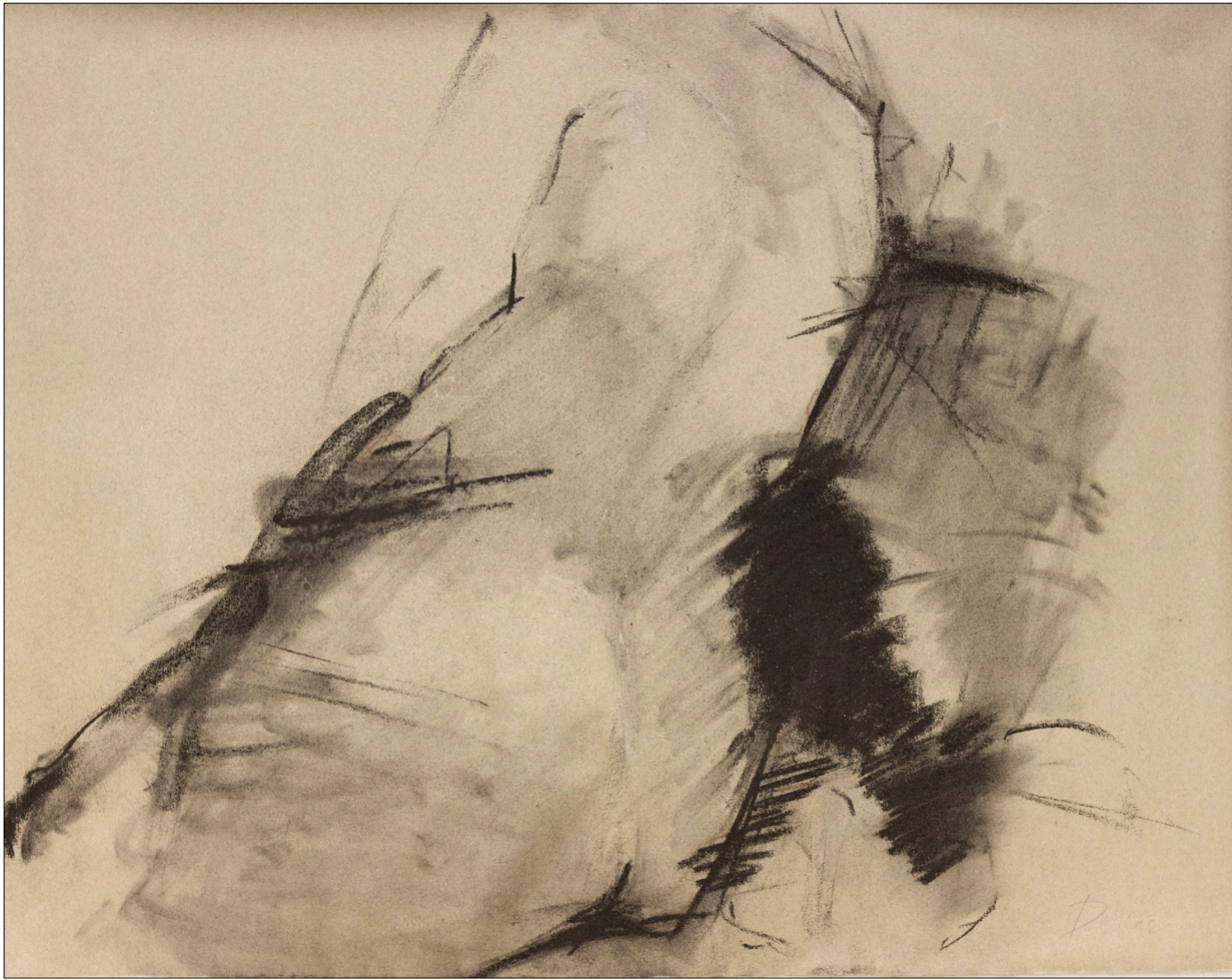
Zeichnung 520 | 2019 | Kohle auf Bütten 48 x 63 cm