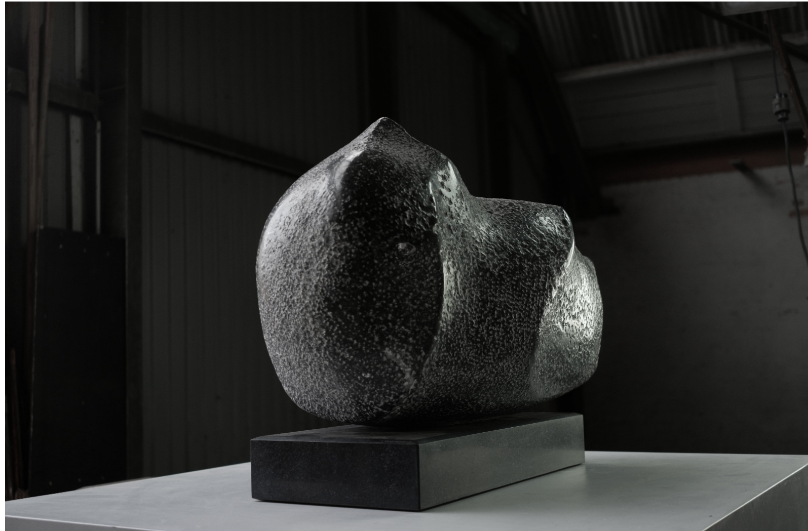
Seminibus | 2021 | valonischer Blaustein (Kalkstein) | taille direct, partiell geschliffen Höhe 35 cm