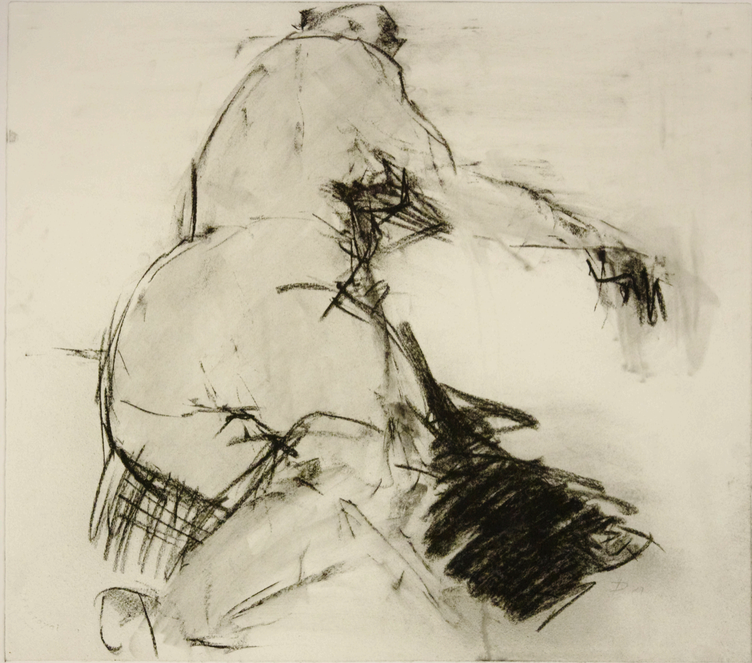
Zeichnung 562 | 2019 | Kohle auf Bütten 54 x 61 cm