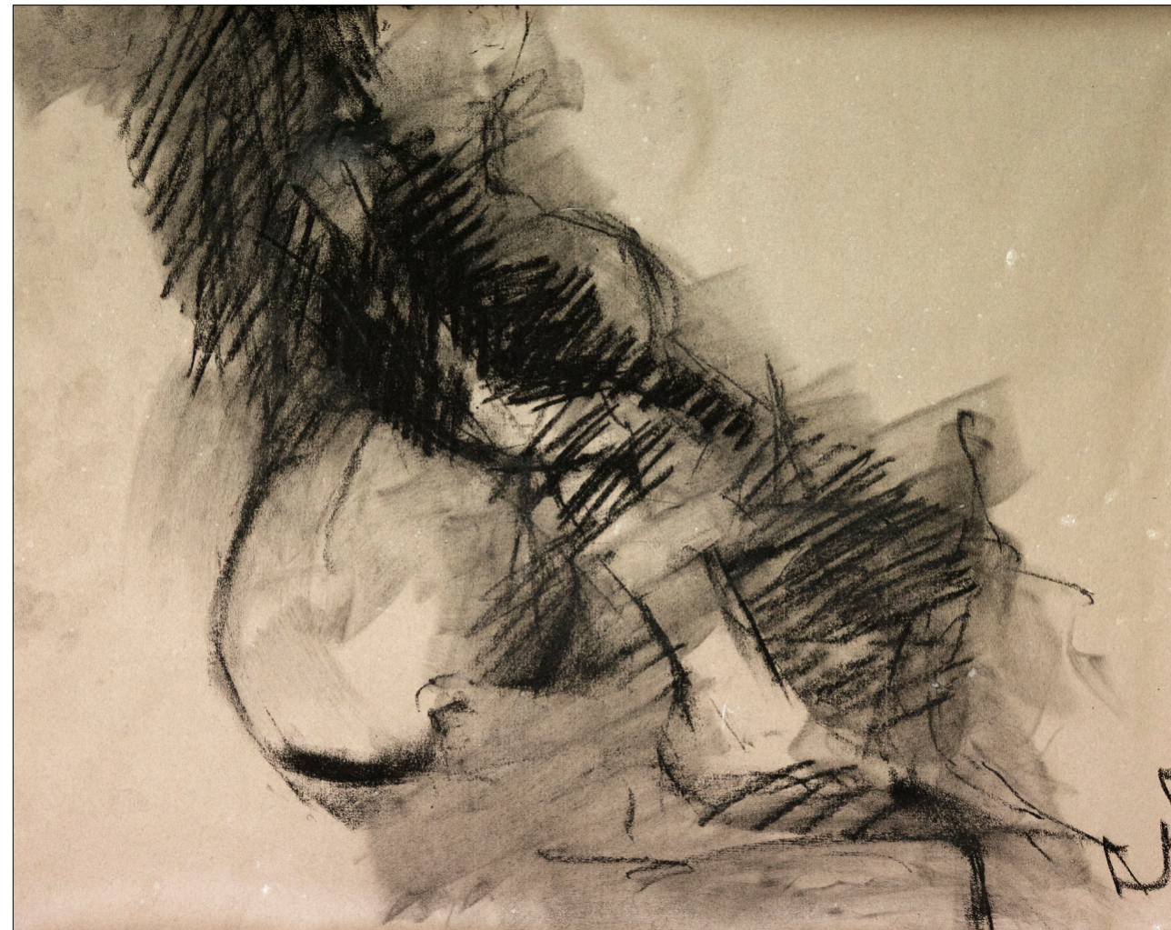
Zeichnung 563 | 2019 | Kohle auf Bütten 48 x 63 cm