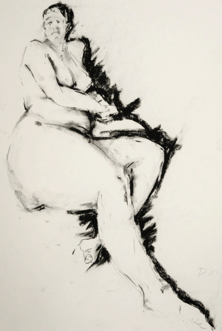
Zeichnung | 2018 | Kohle auf Bütten 54 x 61 cm