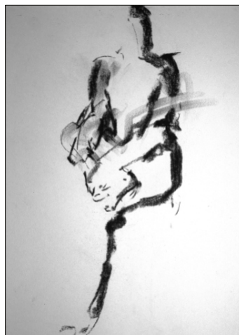
Zeichnung 29/90/91 | 2023 Kohle auf Karton 42 x 30 cm