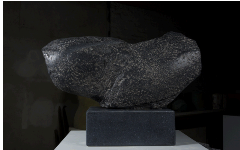
Segment V | 2019 | Schwarz Schwedisch (Ebony Black) | taille direct, partiell geschliffen | Höhe 30 cm