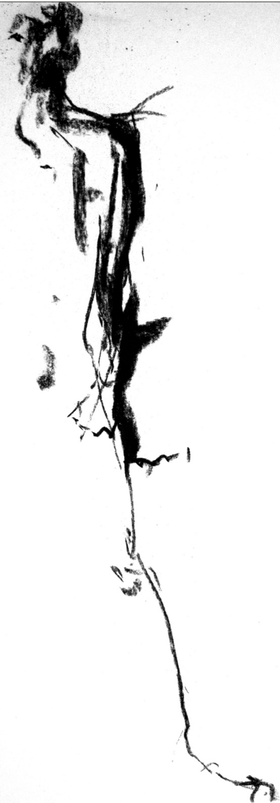
Zeichnung | 2018 | Kohle auf Bütten 42 x 29,7 cm