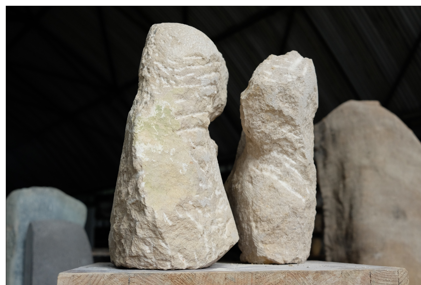
Protein | 2016 | Thüster Kalkstein | taille direct, partiell geschliffen Höhe 32cm